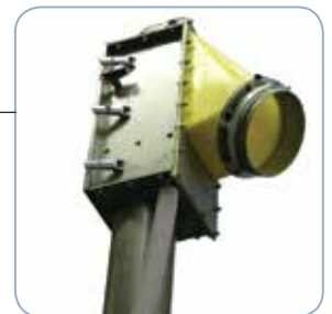
Effizienter Auslaufstutzen aus Kunststoff