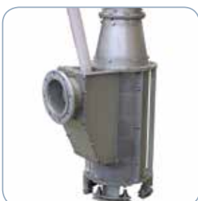
Einlaufstutzen und geteilter Siebkorb